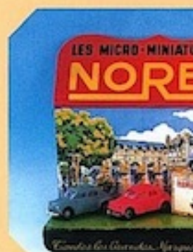
Sur un présentoir "Les Micro-Miniatures lithographiée, avec comme décor le châssis de deux 4 CV Renault Nore, 1958, plastique.