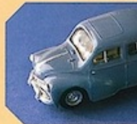
Jouet rétro, 2003 : 4 CV Renault, Micro-plastique, 1/86.